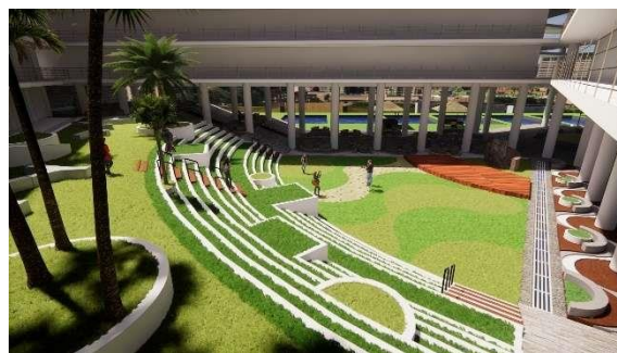
Gambar 10. Ruang komunal Pertama pada Amphitheater

Tujuan utama membuat ruang komunal kedua pada bagian basement ini adalah mendukung