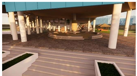
Gambar 13. Ruang Komunal Keempat pada lobby