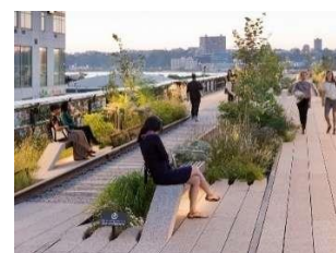
Gambar 6. The highline park in New York