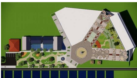
Gambar 9. Blockplan Perencanaan Desain Ruang Komunal

Penempatan ruang komunal pada lobby sebagai jembatan untuk mengakses sirkulasi manusia utama di bagian plaza dengan ketiga ruang komunal lainnya.