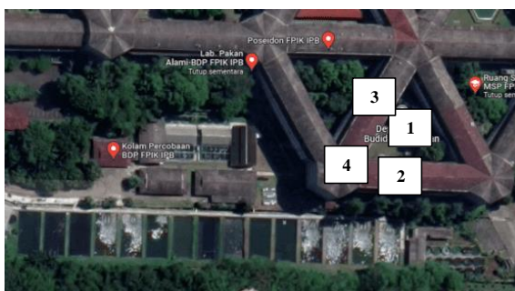
Gambar 2. Keterangan Lokasi Rencana Ruang Komunal

Ruang komunal pertama adalah ruang komunal yang berupa amphitheater atau podium pertunjukan dengan taman yang luas dibagian kontur paling tinggi dan kontur paling rendah, ruang komunal kedua, ketiga dan ke-empat berada di basement Gedung FPIK IPB yang bisa digunakan untuk berbagai macam kegiatan. Berdasarkan survey yang dilakukan, keadaan semua ruang komunal ini tidak layak, dengan arti lain tidak terawat, banyak pepohonan dan rumput liar, beberapa sampah terlihat, dan sangat kumuh untuk dijadikan tempat berkumpul atau bersosialisasi.