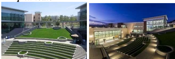
Gambar 8. California state university San Marcos in USA