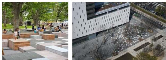
Gambar 7. Teikyo Heisei University Nakano Campus in Japan