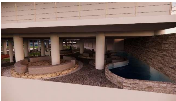
Gambar 11. Ruang Komunal Kedua pada basement

Tujuan mendesain bagian ruang komunal ketiga ini yaitu menambahkan tanpa merubah lapangan olahraga yang sudah ada pada eksisting, bagian ini bentuk desain terinspirasi dari pasir pantai yang bertemu obak sehingga menciptakan gelombang air dan menginterpretasikannya kedalam bentuk modern.