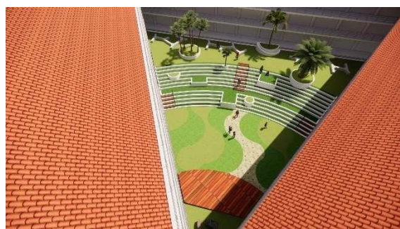
Gambar 10. Perspektif bird eye ruang komunal pertama

Di Ruang komunal pertama atau pada bagian yang dibuat amphitheater terbuka ini mengambil tipe Amphitheater Yunani Kuno, yang berbentuk setengah lingkaran. Fungsionalnya tidak hanya untuk tempat pertunjukan atau tempat bercengkrama, melainkan bisa digunakan sebagai tempat beraktifitas yang membutuhkan lahan yang luas. Perletakan kursi taman pada bagian kontur teratas merupakan tempat pertemuan antara 3 gedung FPIK IPB yang terhubung untuk memobilisasi interaksi sosial.