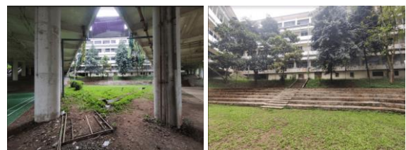
Gambar 5. Kondisi Eksisting Amphitheater Ruang Komunal