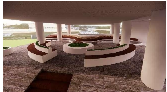
Gambar 12. Ruang Komunal Ketiga pada basement

Ruang komunal terakhir berada di lobby gedung FPIK, lobby ini menghubungkan sirkulasi pejalan kaki, sirkulasi kendaraan utama, dan plaza dengan ketiga ruang komunal sebelumnya. Pada kolom yang berada ditengah ditambahkan bentuk peta yang mengelilingi kolom dan distraksi berbentuk lingkaran memusat pada kolom.