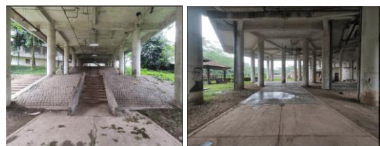
Gambar 4. Kondisi Eksisting Basement Ruang Komunal